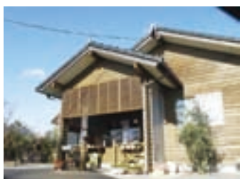
松井ファーム 前橋市上佐鳥町 1189-1 Tel. 027-265-1086

7種の食べ比べが出来る「いちご狩り」もこの時期限り。 甘いいちごについつい頬が緩んでしまう。