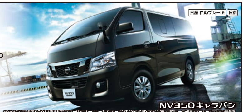
photo/パナソニックAMGX(6人乗6ドア)エマージェンシーブレーキパッケージ AT 2000 2WD ロングボディ/標準ルーフ/低床※メーカーオプション装着車