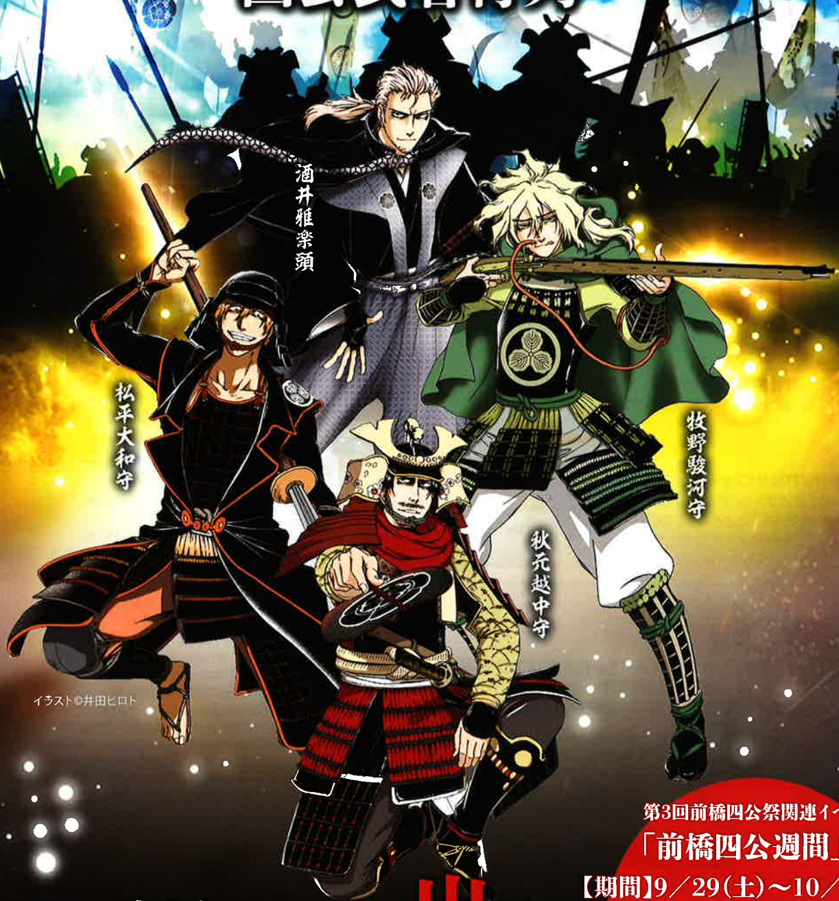
イラスト 井田ヒロト